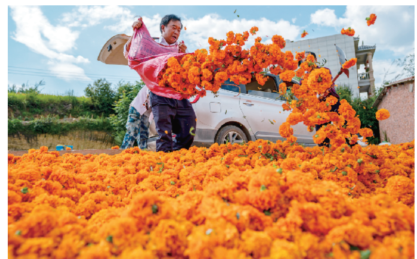
云南马龙:花卉产业铺就乡村振兴路

新华社北京8月11日电 记者11日从教育部获悉,为巩固义务教育阶段学科类校外培训治理成果,切实维护人民群众合法权益,教育部部署开展了持续三个月的“回头看”工作,现已顺利完成。各地累计排查培训机构17.2万个(含已关停的机构复查及非学科类机构涉嫌开展学科类培训排查)、培训材料24.3万份、从业人员40.5万人。据了解,各地围绕机构压减、“营转非”、培训收费、学科类隐形变异、培训材料和人员管理、监管信息化、风险防范七个方面进行全面排查整改,排查中发现问题机构4614个,目前整改完成率达100%。其中,在培训收费监管方面,累计排查发现未执行政府指导价的机构206个,超政府指导价收费82万元,已全部完成整改并全额退回超收培训费。在隐形变异治理方面,累计排查发现违规开展学科类培训的机构3598个,“一对一”等个人违规开展培训1572人次(涉及中小学在职教师15人),已全部完成整改或处理。教育部表示将进一步完善校外培训监管长效机制。紧盯寒暑假等关键节点,压紧压实责任链条,持续保持高压态势,坚决防止违法违规培训出现反弹。