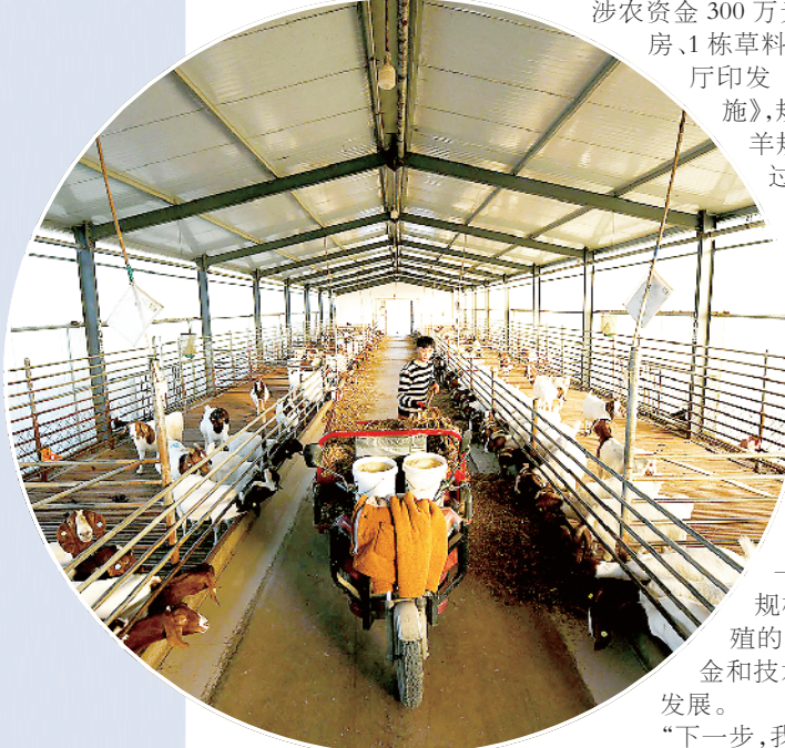
工作人员在羊舍喂羊。

“将我市农作物秸秆作为饲料发展养殖业,是农业增效、农民增收的有效方法。引导广大农民大力发展特色养殖,能走出一条乡村振兴特色产业之路。实现种植业和畜牧业良性循环发展,不仅响应了党中央生态发展、食品安全的号召,而且对于擦亮周口农业品牌,建成农业强市,促进一二三产业优化发展,助力乡村振兴,作用巨大。”市委农办主任,市农业农村局党组书记、局长张华说。