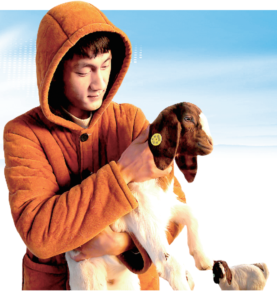
工作人员查看羊羔生长情况。