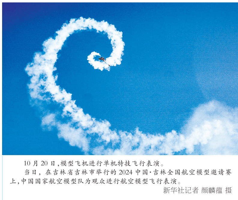
10月20日，模型飞机进行单机特技飞行表演。当日，在吉林省吉林市举行的2024中国·吉林全国航空模型邀请赛上，中国国家航空模型队为观众进行航空模型飞行表演。

《意见》强调，要优化资源配置，强化统筹领导。加大博士研究生教育投入力度，建立健全稳定支持机制。支持有条件的地区和培养单位先行先试、分类分批开展改革试点。