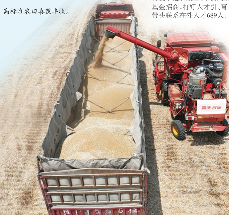
高标准农田喜获丰收。