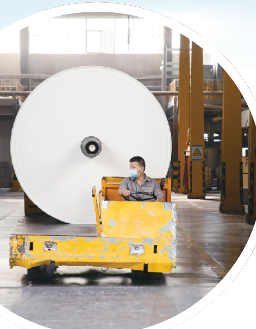
护理佳纸业生产车间。

2025年是“十四五”规划收官之年,也是“十五五”发展谋篇布局之年,做好各项工作意义重大,鹿邑县上下必须在把握大局大势中准确识变、科学应变、主动求变,在锚定目标中真抓实干、务实重干、埋头苦干,增强做好2025年工作的信心和底气,保持只争朝夕、奋发有为的精神状态,推动各项工作争先创优、走在前列,奋力夺取经济社会高质量发展的新胜利!