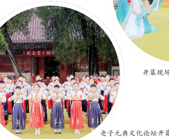
老子元典文化论坛开幕式。