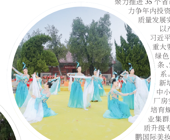
开幕现场歌舞表演。