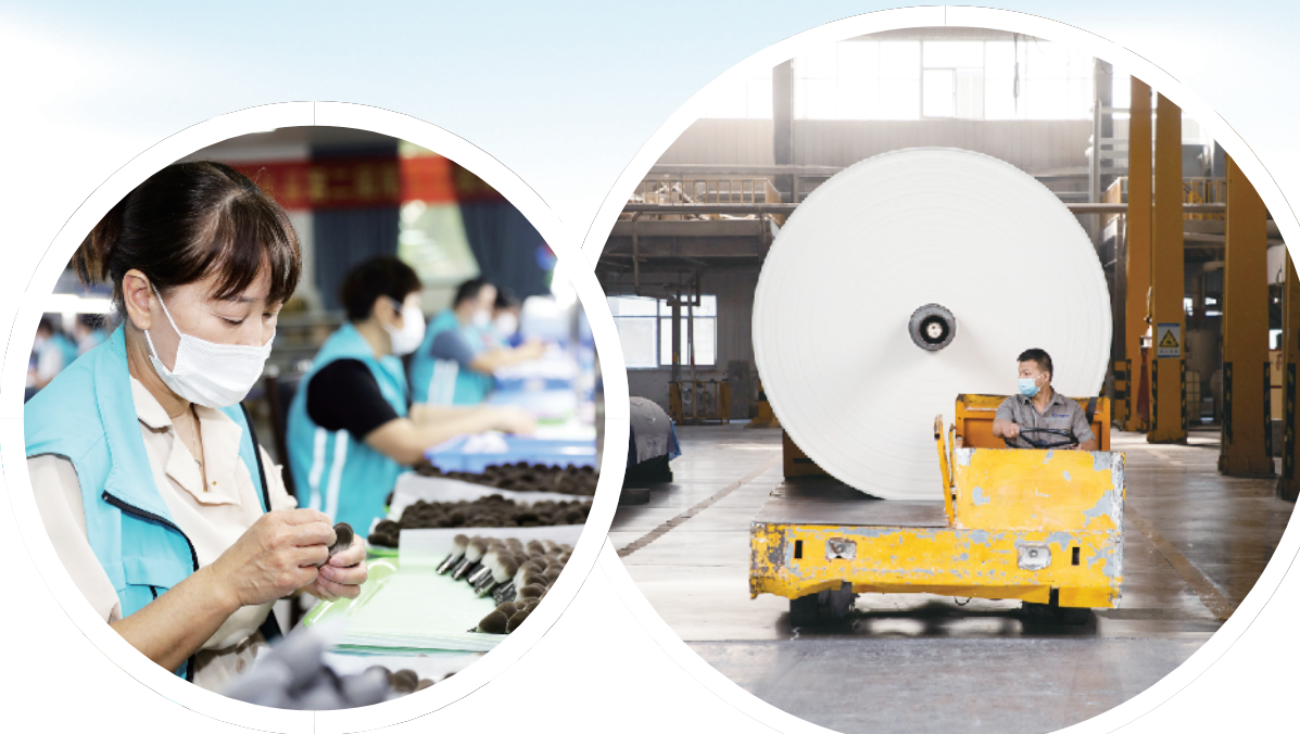
工人加工制作化技刷。