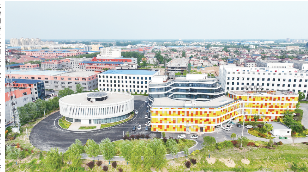
鹿邑创客小镇一角。

力打造“文化游+工业游”标准化示范基地。深入学习贯彻习近平总书记关于家庭教育家风建设重要论述,传承弘扬老子文化尊贵德思,开展道德文化普及“五个一”活动,让崇德守德、向上向善、和谐和睦蔚然成风,维护大美鹿邑良好形象。以加强普惠性基础性兜底性民生建设增福祉。鹿邑县坚定落实习近平总书记“团结带领群众向着共同富裕目标稳步前行,切实保障和改善民生”等重大要求,坚持尽力而为、量力而行,继续实施民生实事,创造高品质生活,完善提升11家区域养老服务中心功能,推动5个镇敬老院转型升级,构建兜底和社会化服务相结合的养老服务体系。完成5所幼儿园提质改造、中改扩建任务,创建30所标准化学校,推动教育提质增效。实施好大规模技能培训提升行动,完成各类培训任务两万人次以上,促进高质量充分就业。加快推进开发区再生水工程,开展引惠入湖等湿地生态修复工程,打造绿色生态环境。持续推进宋河等13个乡镇水源置换工作,力争年内实现水源置换全覆盖。加快推进城市更新,实施3个老旧小区改造项目,打通6条断头路,推进5条道路开工建设,完成7条雨污水管网改造,建设小而美的绿地图袋公园6处,改造提升城区20处老旧小区。坚持和发展新时代“枫桥经验”“浦江经验”,着力建强基层组织,着力创新基层治理,着力推动基层治理“以党建+网格+大数据”等有效方式,用好“三联三化”网格化服务管理、“一村一警”工作机制,充分发挥鹿邑明德学校作用,不断提升党建引领基层治理效能,推进基层治理体系和治理能力现代化,全力维护社会大局安全稳定,守护人民群众安宁幸福。