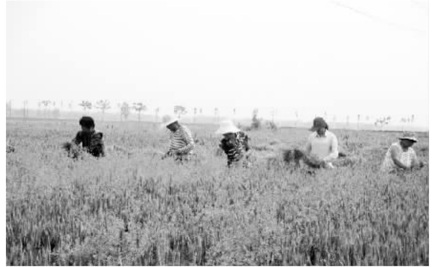
5月8日，沈丘县周营乡谢营村组织的“五朵金花”帮扶队，帮助本村困难家庭在田间除杂草。该乡结合实际，积极帮助留守妇女、老人等困难家庭加强小麦病、虫、草害防治，科学做好小麦中后期的管理工作。 (记者 韦伟 通讯员 谢辛凌)

医院体检中心高主任介绍说：“现在农村生活富裕了，许多农民的健康意识也增强了，好身体是劳动的本钱。他们花几百元做个全面检查，没毛病更好，一旦检查出有什么问题，也便于及时治疗。体检达到了‘无病早防，有病早治’的效果。”就在高主任说话间，笔者看到又有3个农民前来登记体检。 (王向灵 谢辛凌)